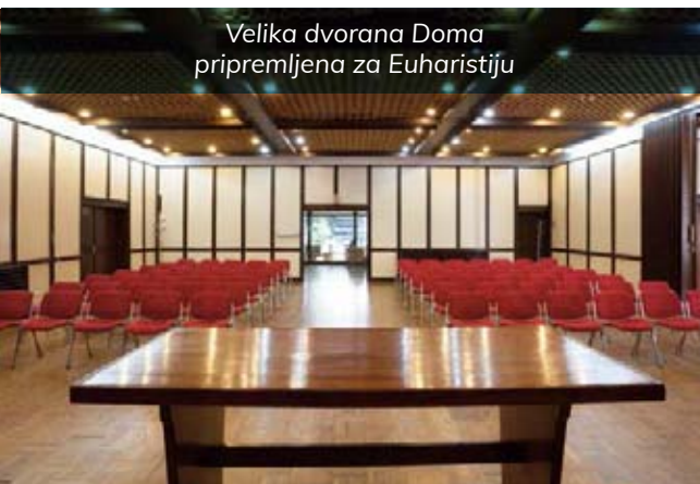
Velika dvorana Doma pripremljena za Euharistiju