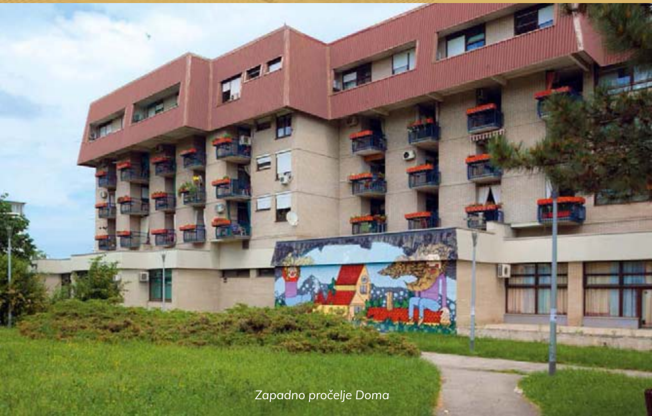
Zapadno pročelje Doma