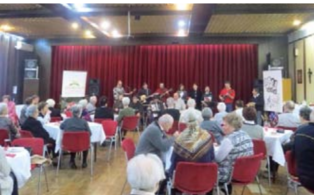
Gore lijevo: Godišnje druženje korisnika Doma i Projekta Gerontološki centar – Ljeto nam se vratilo'