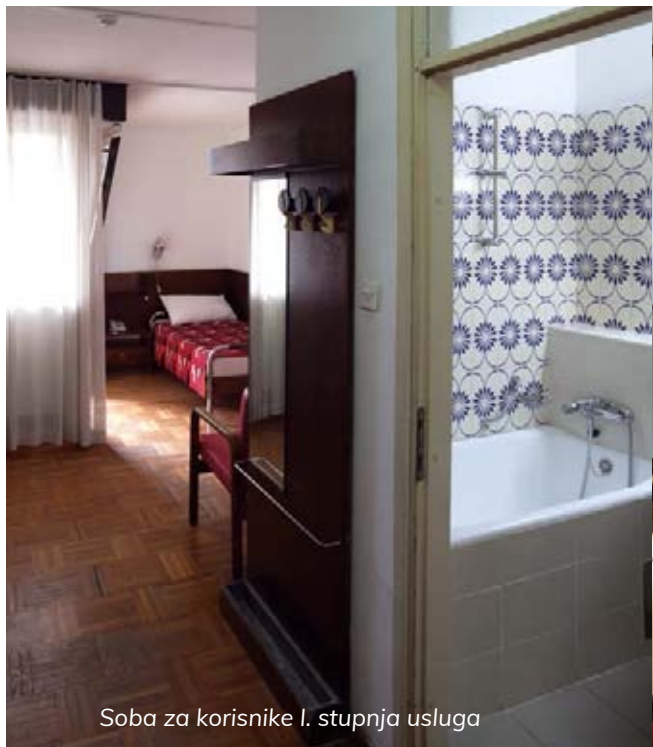
Soba za korisnike I. stupnja usluga

kuhinje na svakom katu, dnevni boravci na svim katovima, velika i mala dvorana za kulturno-zabavna događanja i manifestacije, dvije dvorane za fizičku terapiju, biblioteka, hol s caffè barom, frizerom i pedikerom, računal-